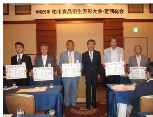
R1.5.28 柏市食品衛生表彰大会にて